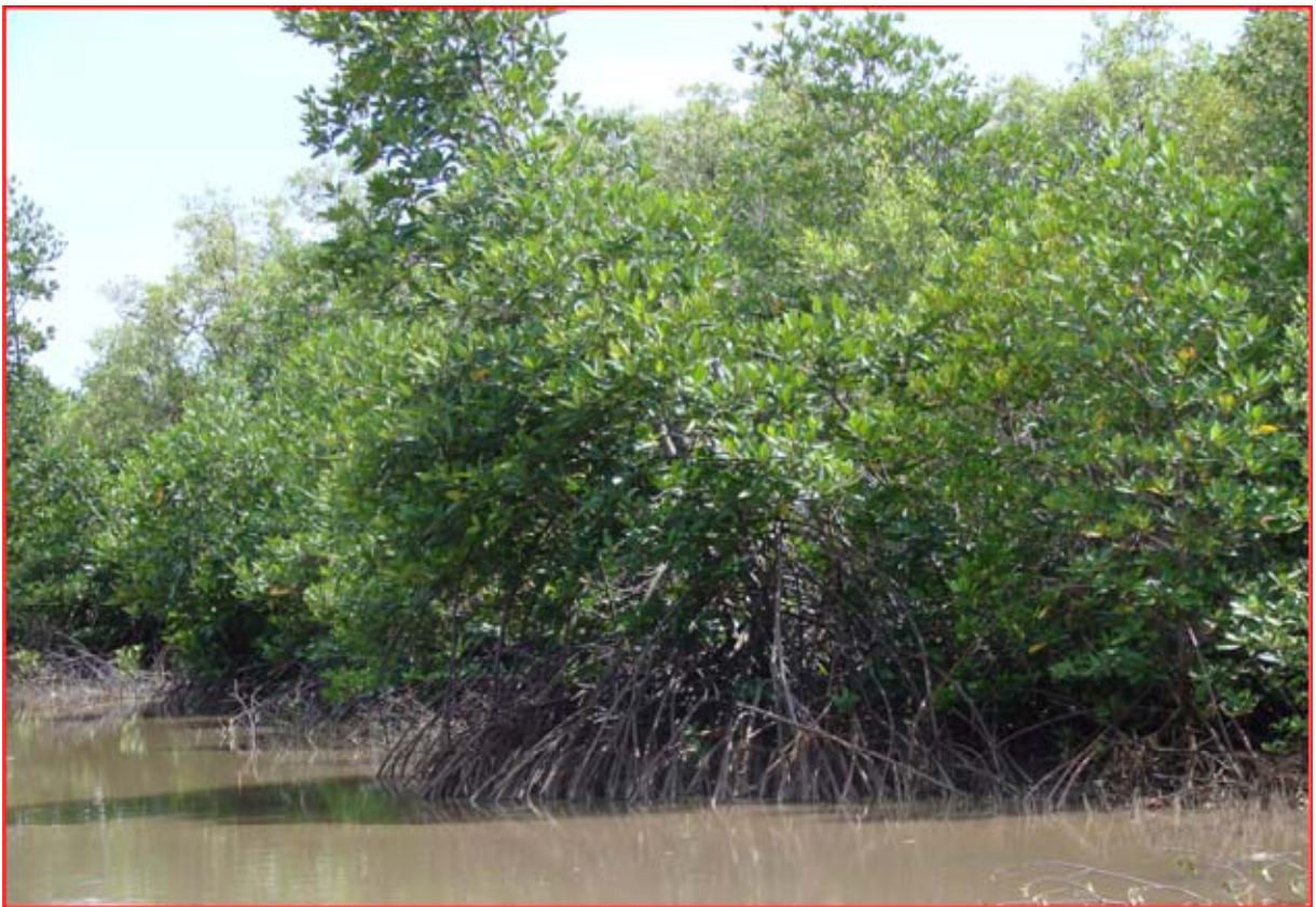
ព្រៃកោងកាងនៅឃុំអង្កោល

តំបន់ទាំងនេះត្រូវតែរក្សាទុកដើម្បីជាលំនឹងបរិស្ថាន ជួយទប់ស្កាត់គ្រោះមហន្តរាយធម្មជាតិជាយថាហេតុ