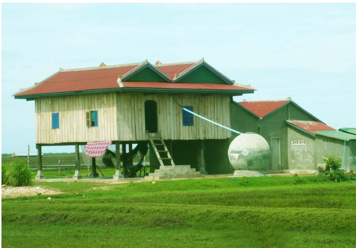
ពាងយក្សសំរាប់ស្តុកទឹកភ្លៀង