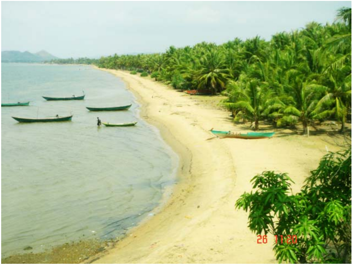
ឆ្នេរកំសាន្តនៅឃុំអង្កោល