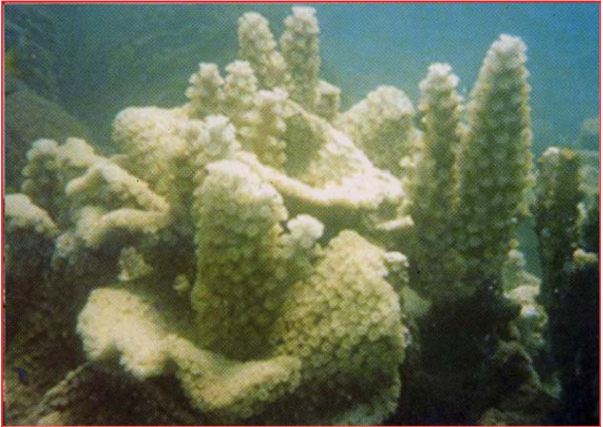
ផ្កាថ្មនៅតំបន់ឆ្នេរអង្កោល